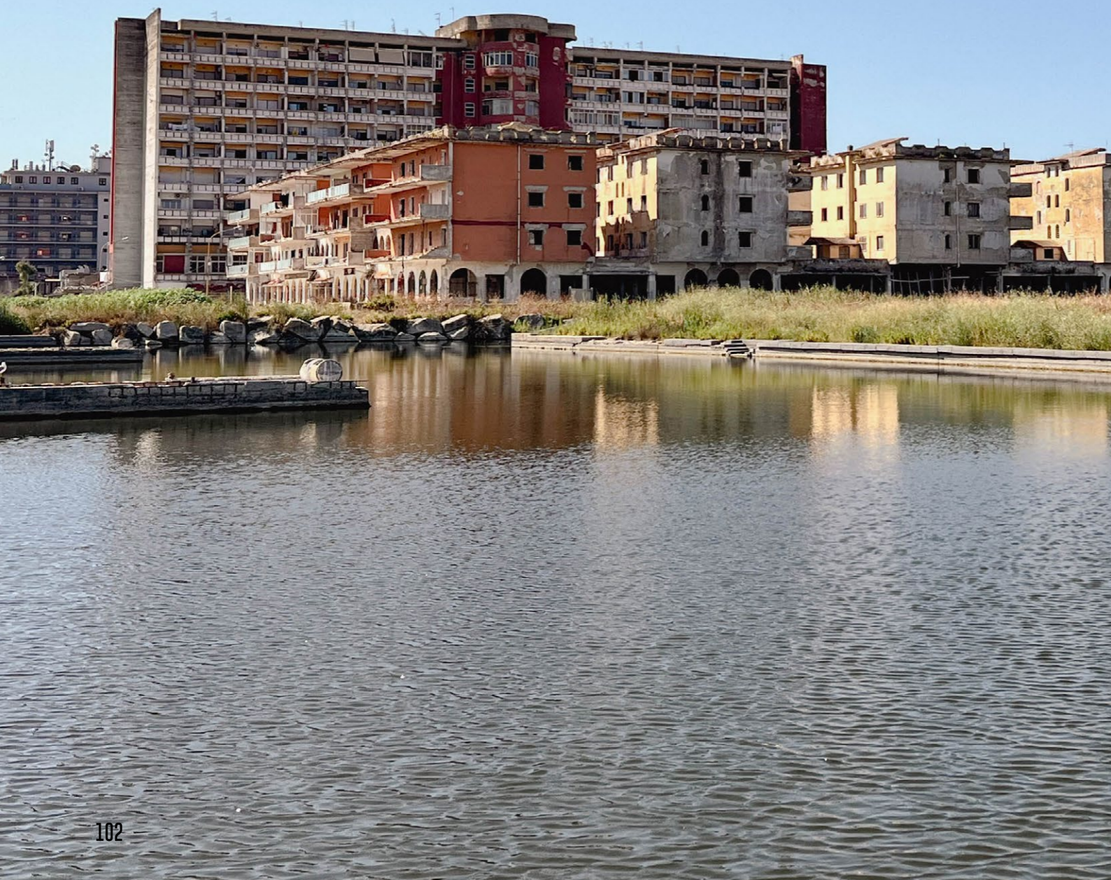
Fig. 00_ Nella pagina precedente, Veduta dalla darsena del porto turistico delle villette residenziali del villaggio Coppola.