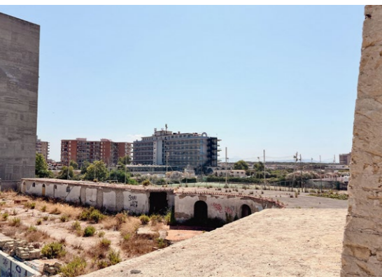
Fig. 09 A sinistra, Veduta dei "Castelli" dalla spiaggia antistante il complesso residenziale.