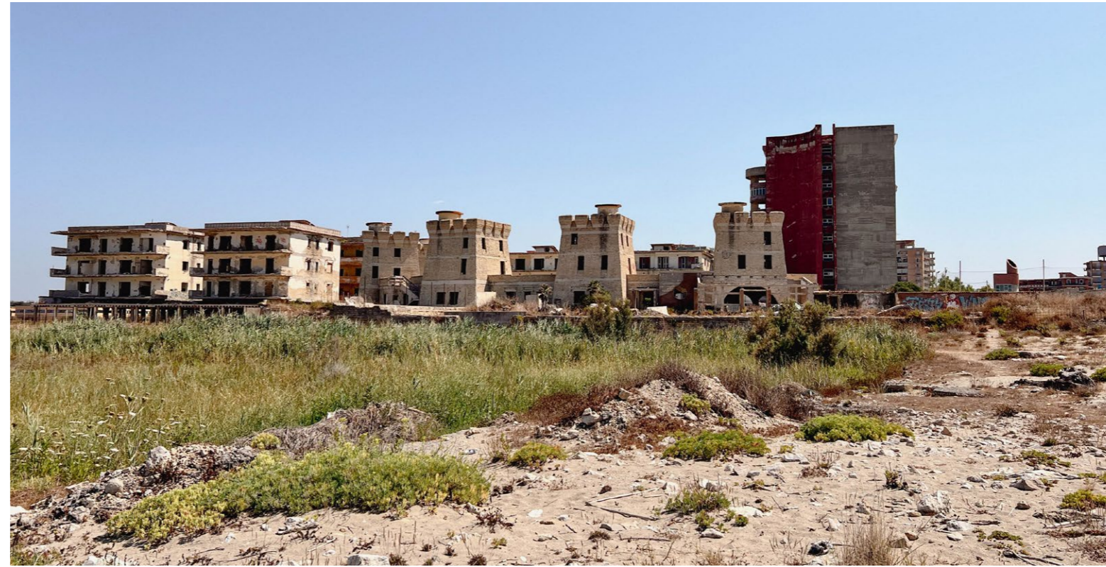
Fig. 06 Nella pagina precedente, in alto, porzione degli edifici residenziali del Villaggio Coppola.