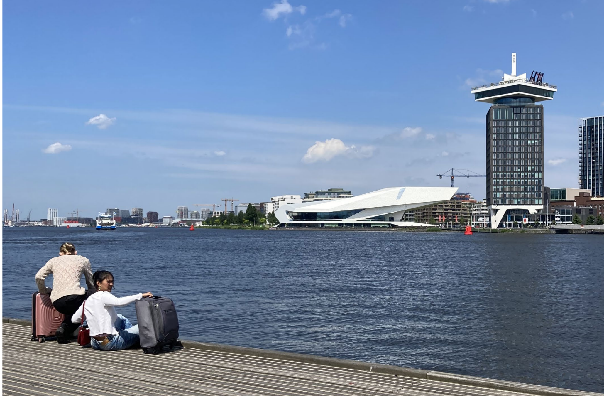
Fig. 00 Vista sull'IJ dalla banchina dell'Uboulevard, Amsterdam.

L'analisi di tre alberghi sorti lungo la direttrice dell'IJ – l'Inntel Hotel Landmark a Oostenburg, l'Hotel Jakarta