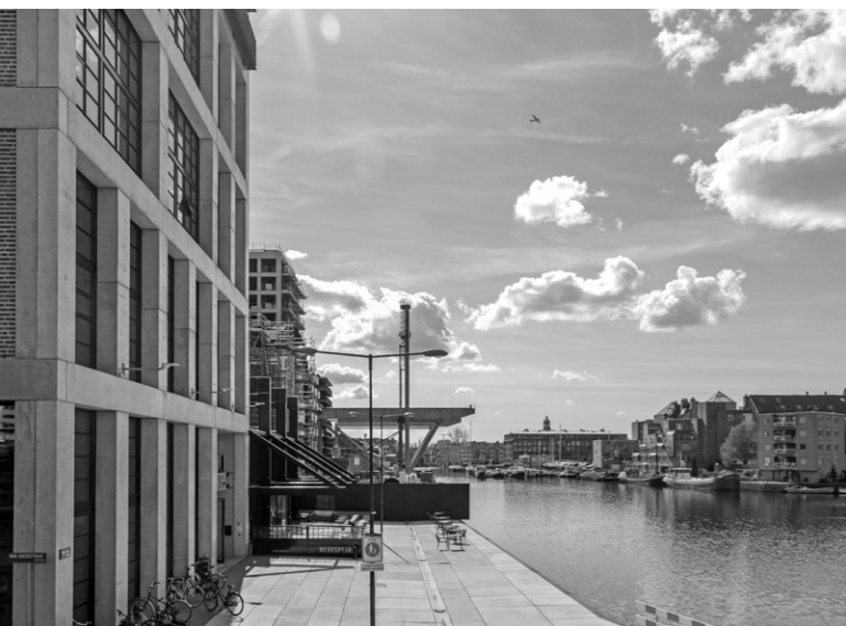
Fig. 02 _ L'Inntel Hotel Landmark e Oostenburg in costruzione, Amsterdam.

Un'ulteriore direttrice strategica di sviluppo si delinea lungo le sponde dell'IJ, ambito privilegiato della trasformazione urbana contemporanea di Amsterdam (Zurli 2020), segnato dalla progressiva dismissione di infrastrutture portuali e industriali e oggi teatro di intensi processi di rigenerazione, che combinano residenza, lavoro, cultura e ospitalità in forme ibride. Tra queste, l'ex area industriale NDSM, oggi riconvertita in distretto creativo mixed-use , accoglie spazi espositivi, luoghi di produzione culturale, housing e spazi per l'ospitalità. Dagli anni Novanta la sua riconversione, inizialmente informale, ha attratto un inedito turismo culturale, ma ha anche innescato dinamiche di gentrificazione con ricadute controverse sull'identità sociale, culturale ed economica del quartiere (Labuhn 2019). Processi analoghi interessano altri tratti del waterfront occidentale, come i quartieri di Houthavens e Minervahaven , un tempo aree logistiche e oggi oggetto di interventi che integrano nuovi spazi per l'abitare, il lavoro e il tempo libero con una rete di spazi per l'ospitalità in progressiva espansione.