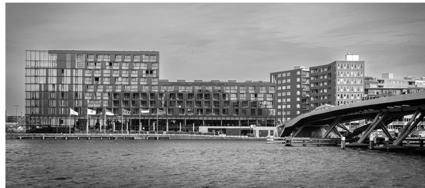
Fig. 03 _ L'Hotel Jakarta e il Jan Schaeferbrug nella Java-eiland, Amsterdam.

Se sul lato orientale l'edificio assume una forma più compatta, in dialogo con la scala del tessuto residenziale, sul lato occidentale – affacciato sull'IJ – si apre e si smaterializza progressivamente, aprendo la sua corte interna verso il paesaggio portuale. L'accesso principale, posto lungo la sponda nord dell'isola, introduce a una lobby a doppia altezza in continuità con lo spazio centrale dell'edificio. Il piano terra ospita una sequenza di funzioni pubbliche e collettive – ristorante, bar, lounge , spa, uffici – distribuite lungo un percorso anulare che accompagna la geometria aperta della corte. Questo spazio centrale è concepito come un giardino subtropicale coperto che evoca l'atmosfera dell'Indonesia coloniale, richiamando esplicitamente l'eredità storica del sito, da cui un tempo salpavano le navi dirette verso le Indie orientali. L'uso estensivo di superfici vetrate consente di illuminare naturalmente gli spazi collettivi, attenuando significativamente lo stacco tra spazi interni ed esterni. La permeabilità visiva e spaziale che ne consegue rende gli spazi collettivi dell'edificio – il giardino coperto, la lobby , il ristorante – una soglia abitata tra città e acqua, tra scala di quartiere e scala territoriale.