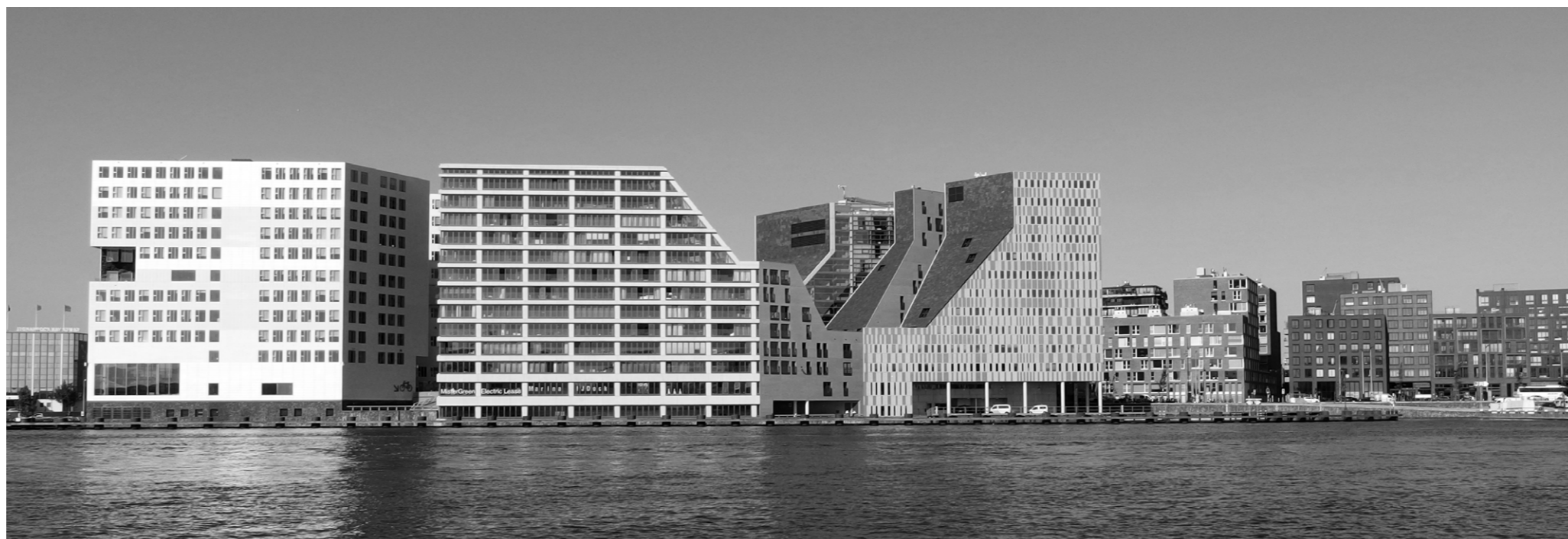
Fig. 04_ Il fronte est dell'IJDock dall'IJ, Amsterdam.

I progetti analizzati si pongono in continuità con le politiche di sviluppo turistico-ricettivo adottate dalla capitale olandese nel corso dell'ultimo decennio, contribuendo a consolidare un modello insediativo policentrico. La loro localizzazione in aree esterne ai circuiti turistici più saturi, ma comunque prossime e accessibili dalla rete di trasporto pubblico e di mobilità lenta, conferma la volontà di decentrare l'offerta ricettiva, favorendo l'interazione tra il programma alberghiero e gli ordinari tessuti residenziali, lavorativi e produttivi della città.